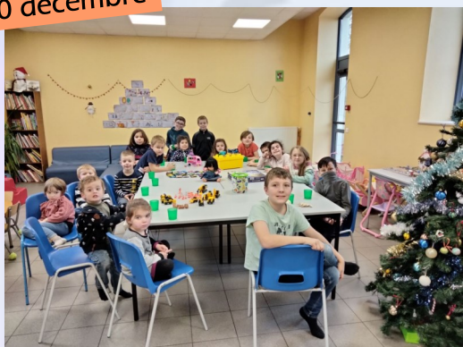
Noël au centre de loisirs