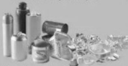
Tous les emballages en métal, même les plus petits