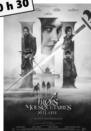
Les 3 mousquetaires : Milady