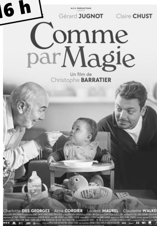
Comme par magie