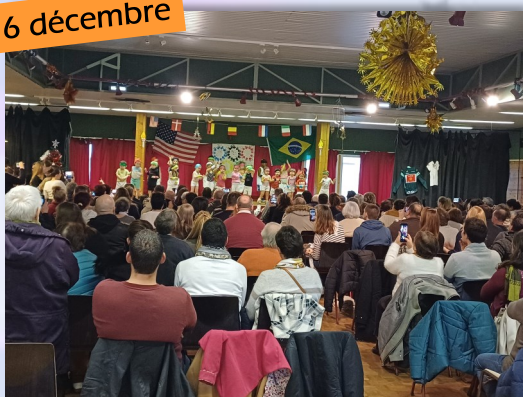
Fête des Ecoles