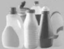
Toutes les bouteilles et flacons en plastique