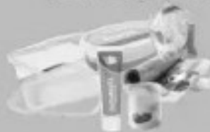
Tous les autres emballages en plastique