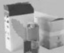
Tous les petits emballages en carton