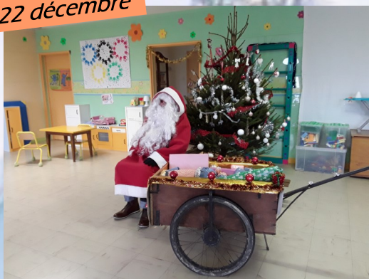
Visite du père Noël à l'école maternelle