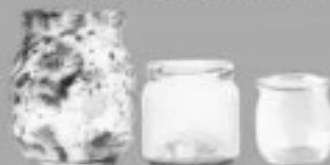
Pots et bocaux en verre